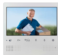
1 moniteur couleur 18 cm à touches sensibles