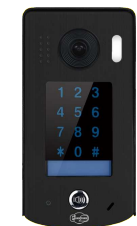
1 platine de rue Inox noire avec visière anti-pluie